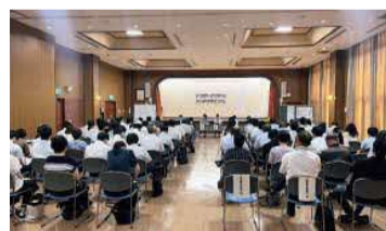
分科会の様子（高森町会場）

また、分科会は「学校人権同和教育部会」が4つ、「就学前人権同和教育部会」と「社会人権同和教育部会・部落解放部会」が1つずつで、各会場に75人～100人の参加者が集い、2本のレポート発表、質疑応答、意見交換、まとめという流れで行われました。ここでは、私が参加した西原村会場についてご紹介します。