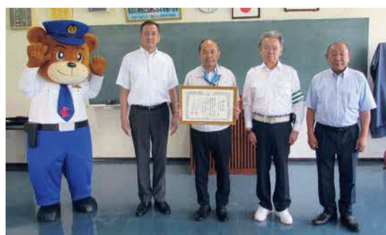
管区連名表彰 優良事業所 阿蘇農業協同組合高森支所