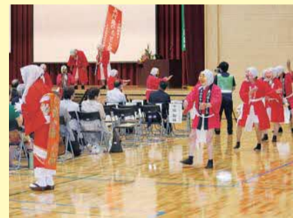
「ひよっここ踊り」を披露する 「日向伝承阿蘇ひよっこ会」の皆様