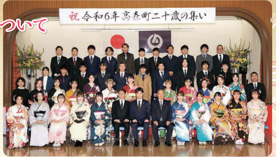
令和6年二十歳の集いの様子

平成16年4月2日から平成17年4月1日までに生まれた方で、高森町に住民票がある方、高森町内の小中学校に在学していた方（現在高森町に住民票がなくても高森町出身の方は参加できます。）