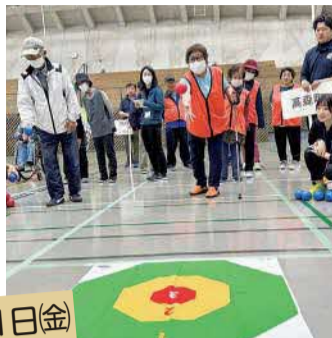
10月11日(金) ポッチャの様子

10月11日、小国町・小国ドームで第45回阿蘇郡市身体障害者体育大会が開催されました。これは身体障がい者の健康保持と生きがいを高め、お互いの親睦を図ることを目的に毎年阿蘇郡市の市町村で開催されています。